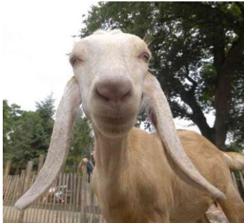
Er zijn ook geiten met hangoren, zoals de Anglo-Nubische geit

Geiten kunnen goed horen. Ze kunnen hun oren draaien, zodat ze veel geluiden in de omgeving kunnen horen. Sommige geiten hebben langere oren dan andere geiten. Ook de vorm van de oren kan anders zijn.