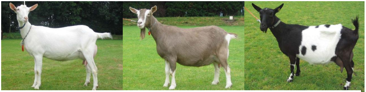
Op een rij de Nederlandse witte geit, de Toggenburger en de Nederlandse bonte geit

Geitenboeren in Nederland houden vaak meerdere rassen door elkaar.