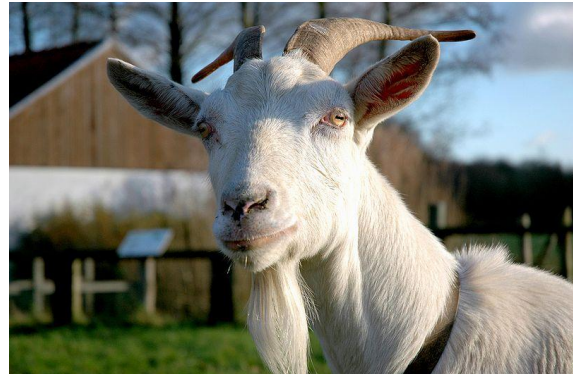
Een biologische geit mag naar buiten

De melk van een biologische geit is meestal iets duurder. Dit komt doordat de boer geld moet uitgeven aan de wei, speeltjes en biologisch voer.