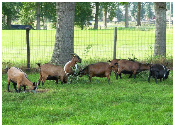
Een groep West-Afrikaanse dwerggeiten

Sommige geiten worden voor de hobby gehouden. Dit zijn meestal dwerggeiten. De geit die je vaak op een kinderboerderij ziet rondlopen is de West-Afrikaanse dwerggeit. Daar zie je ook vaak hele grote geiten met lange hangende oren rondlopen. Dat is de Anglo-Nubische geit.