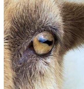
Geiten kunnen goed zien

Van veraf kunnen geiten al zien of er andere geiten of roofdieren in de buurt zijn. Roofdieren zijn dieren die andere dieren opeten, ook geiten! Als een geit iets heeft gezien, staat ze vaak even stil om beter te kijken. Daarna vlucht ze als het een roofdier is, maar als ze nieuwsgierig is gaat ze kijken.