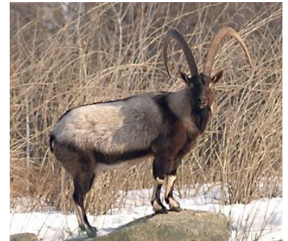
De Bezoargeit is een van voorouders van de huisgeit.