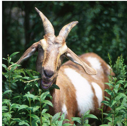
Geiten knabbelen graag

Geiten vinden vooral lange grassen, bladeren en takken lekker. Voordat geiten iets opeten, raken ze het eerst aan met hun gevoelige lippen. Daarna proeven ze het. Als ze het lekker vinden eten ze het op. Omdat geiten even op hun achterpoten kunnen staan, kunnen ze ook hogere plekjes bereiken.