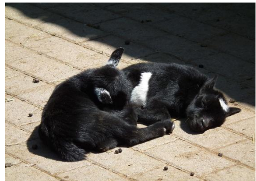
Jonge geiten lekker aan het slapen

Geiten zijn echte gewoontedieren: het liefst doen ze elke dag hetzelfde op dezelfde tijd.