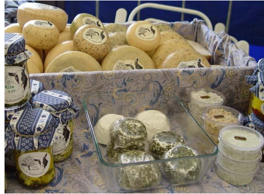
Verskillende soorten geitenkazen