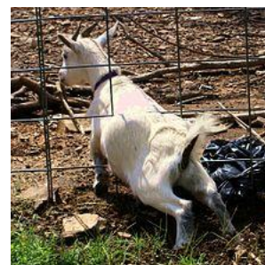
Geiten hebben snel door hoe ze kunnen ontsnappen.

Omdat ze slim zijn, hebben ze vaak door hoe ze kunnen ontsnappen. En als één geit door heeft hoe hij moet ontsnappen, weet de groep dit ook al snel.