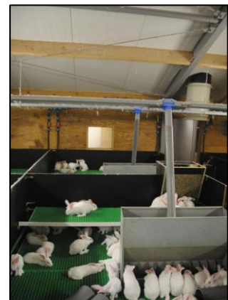
Vleeskonijnen in een groep

De meeste vleeskonijnen worden in groepen van 5 tot 35 dieren gehouden. Als ze in een groep met minder dan 5 konijnen zitten, dan moeten ze minstens 0,07 vierkante meter ruimte hebben. Dat is minder dan een vel papier. Als er meer dan vijf dieren in een groep zitten, moet elk konijn minstens 0,06 vierkante meter ruimte hebben. Er zijn regels voor hoe groot de hokken moeten zijn. Als konijnen in kleine groepen zitten, kunnen ze meestal niet huppelen of rennen. In grotere groepen kan dat vaak wel. De kooi moet hoog genoeg zijn (minstens 40 centimeter). De konijnen kunnen dan nog op hun achterpoten staan, omdat ze dit graag doen. Weet je nog waarom? Ze kunnen dan rondkijken of er vijanden aankomen.