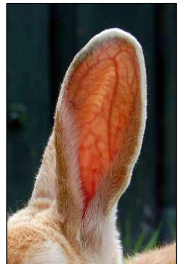
Bloedvaten in het oor

De oren van een konijn werken ook zo. Als een konijn het warm heeft, kan hij de warmte die hij teveel heeft, meegeven aan het bloed. De oren zijn maar dun, dus wordt de warmte makkelijk meegenomen door de lucht. Het konijn koelt dan dus af en heeft het minder warm.