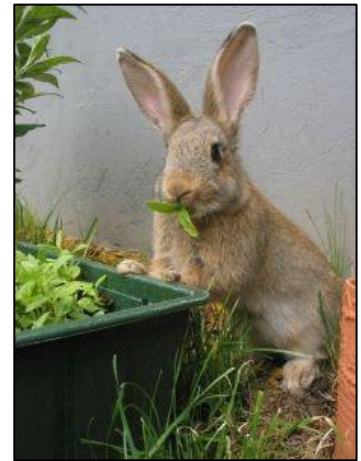
Etend konijn

Meestal eet een konijn verdeeld over de dag een heleboel kleine beetjes. De meeste mensen eten drie keer per dag: ontbijt, middageten en avondeten. Maar konijnen eten wel 30 tot 40 keer per dag! Als het donker begint te worden, eten ze het meest.