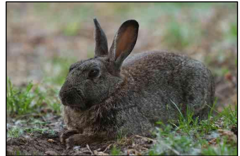
Liggend konijn

Wanneer een konijn zich veilig en ontspannen voelt, gaat hij languit gestrekt op de grond liggen. Soms rollen ze zich ook om. Het liefst rust een konijn onder struiken of in een konijnenhol. Zo kunnen roofdieren hem niet zo makkelijk vinden.