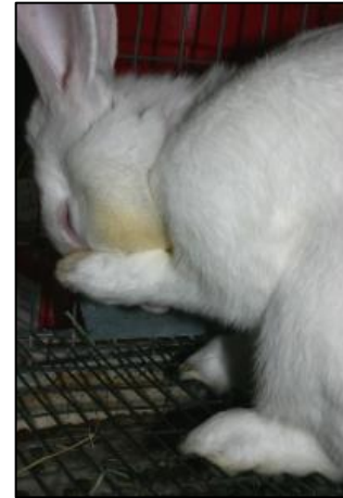
Konijn poetst zichzelf

Net als veel andere dieren krijgt een konijn soms een nieuwe vacht. Hij verliest dan veel haren en krijgt daar nieuwe haren voor terug. Het verliezen en het aangroeien van een nieuwe vacht heet in de rui zijn. Een konijn dat in de rui is, wast en krabt zich vaker dan normaal. Al die losse haren kriebelen natuurlijk. Dat is ook als je zelf net bij de kapper bent geweest.