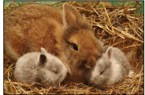
Konijn met jongen

Konijnen zijn ongeveer 4 weken drachtig en krijgen dan ongeveer 5 jongen. De meeste wilde konijnen krijgen 2 of 3 nestjes jongen achter elkaar in één jaar. Het eerste nestje wordt in maart geboren en het laatste in juli. Daarna wordt er weer gewacht tot het volgende jaar. De tamme konijnen die wij houden, kunnen het hele jaar door jonge konijntjes krijgen.