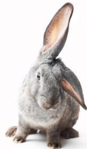
Konijn met grote oren