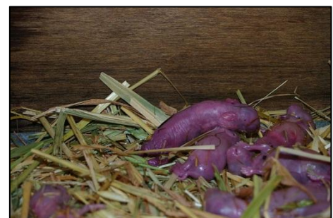
Pasgeboren jongen

Jonge konijnen worden kaal, blind en doof geboren. Ze krijgen het niet snel koud, omdat hun moeder een nest van gras en zachte haren van haar vacht gemaakt heeft. De moeder gaat alweer snel na de geboorte op zoek naar eten voor zichzelf. Ze laat haar jongen dan achter in het nest en gaat via een speciale zijgang in het konijnenhol weg. Als ze buiten is, maakt ze de zijgang weer goed dicht en weet verder niemand waar die zit. Zo zijn haar jongen goed verstopt.