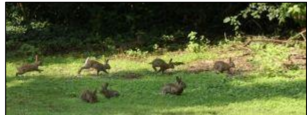
Groep wilde konijnen

Als er weinig konijnen in een gebied leven, zijn ze meestal met zijn tweeën. Als er veel konijnen in een gebied leven, gaan ze vaak in grotere groepen samenleven. Meestal bestaat een groep uit 2 of 3 mannetjes met 2 tot 9 vrouwtjes en de jonge konijnen. Als een groep te groot wordt, worden er vaak weer een aantal kleinere groepjes gemaakt.