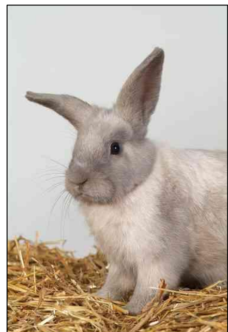
Konijn met lange snorharen

Elke haar zit in je lichaam vast met een haarzakje. Dit is een heel smal buisje waar de haar in zit. Een aantal kleine bloedvatjes brengt voedingsstoffen naar de haar. Helemaal onderaan het haarzakje zit een zenuw: die voelt het als er iets met de haar gebeurt. Als je bijvoorbeeld aan jouw haren trekt, doet dat wel pijn. Dat komt omdat die zenuw doorgeeft aan de hersenen dat er aan de haar getrokken wordt.