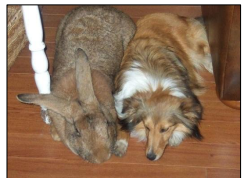
Vlaamse Reus naast een hond

Rassen die gehouden worden voor hun vlees moeten niet alleen veel vlees hebben en snel groeien. Ze moeten natuurlijk ook gezond blijven en de moederkonijnen moeten goed voor hun jongen zorgen. Er zijn drie konijnenrassen die dit allemaal heel goed kunnen. Dit zijn de Californiër, de Witte Nieuw-Zeelander en de Witte van Dendermonde.