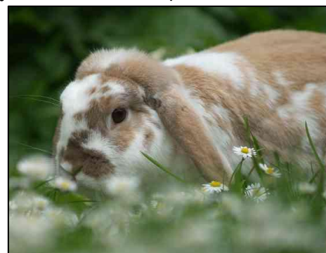
Etend konijn

Net achter de bovenste snijtanden zitten twee stifttanden. Dit zijn twee dunne tandjes die tegen de snijtanden duwen. Ze zorgen ervoor dat de snijtanden niet naar binnen groeien.